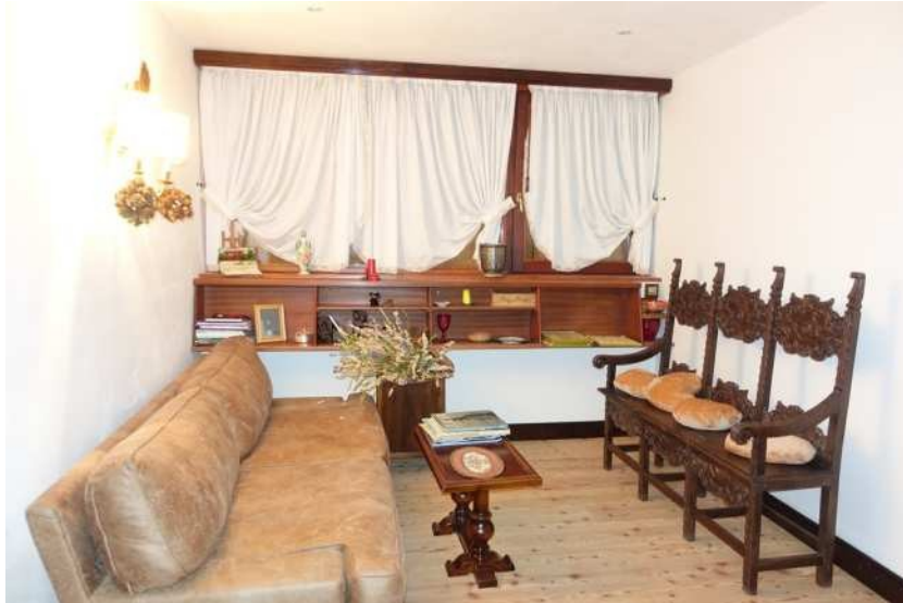
Vista vano al P.T.