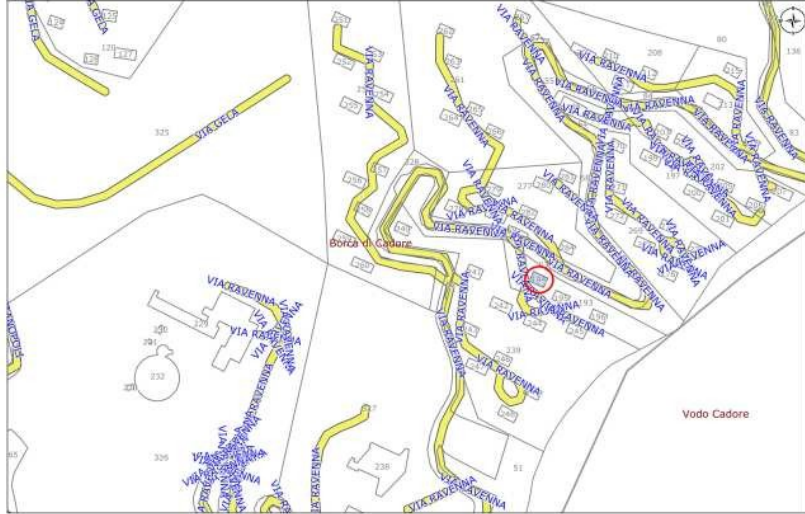
Planimetria con identificazione bene

Per quanto sopra si dichiara la conformità catastale