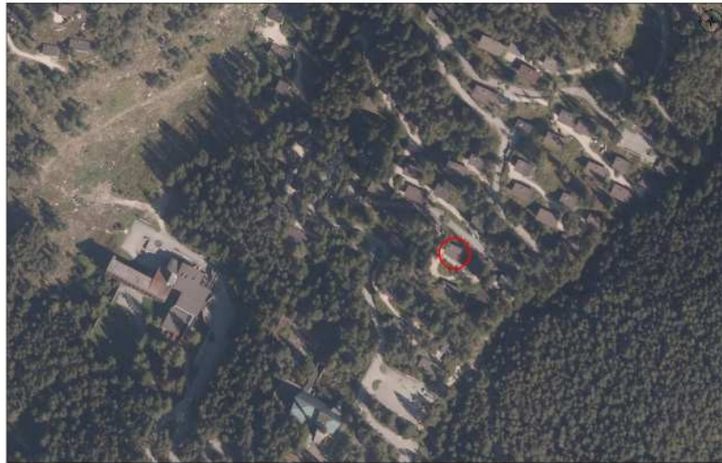
Ortofoto con identificazione bene