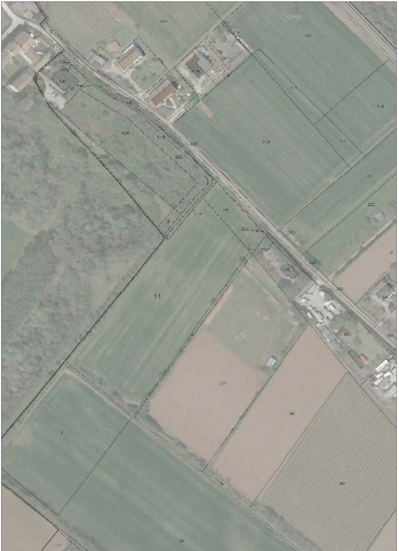
SOVRAPPOSIZIONE TRA MAPPA E ORTOFOTO